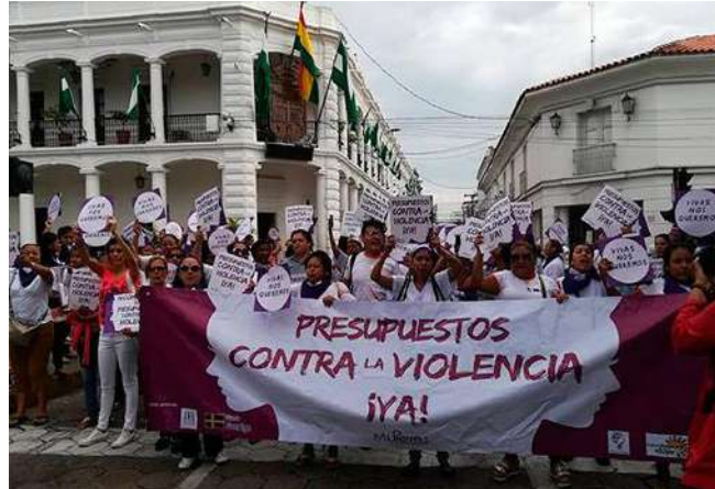
Mobilización "Presupuestos contra la Violencia ¡YA!", marzo, 2017

El departamento de Santa Cruz ocupa el primer puesto en el registro de casos de agresiones a las mujeres. Entre enero y septiembre de 2018, las cifras llegaban a 4.962 denuncias registradas. Le siguen La Paz (3.953) y Cochabamba (3.502).