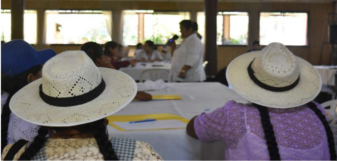
Encuentro para el análisis de los temas de la Agenda Política Departamental desde las Mujeres, 2019-2024.