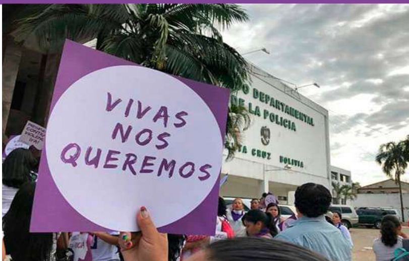
Movilización "Pre-supuestos contra la Violencia ¡YA!", cerca del Comando Departamental de la Policía de Santa Cruz, marzo de 2017.

La pesadilla empezó un día de agosto de 2018, cerca de las dos y media de la madrugada. Mientras la mayoría de la gente aún dormía, una mujer salía de casa, en el municipio de Vallegrande, para dirigirse a su fuente laboral.