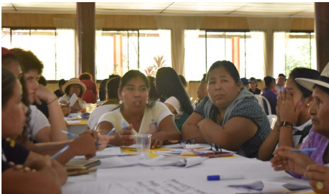
Mesas de diálogo en el encuentro departamental para la Agenda Política de las Mujeres.