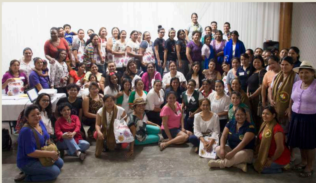
Un grupo de participantes en el encuentro departamental de mujeres por una política pública.

Las mujeres invirtieron tiempo en la readecuación de sus agendas políticas y reflexionaron acerca de la realidad. Sus vivencias asociadas a seis ejes políticos, fueron un importante aporte para la elaboración de un documento construido desde la diversidad en Santa Cruz, que se consolidará como elemento clave en la vocería de las lideresas, que hoy más que nunca están de pie y vigilantes al cumplimiento de sus derechos conquistados.