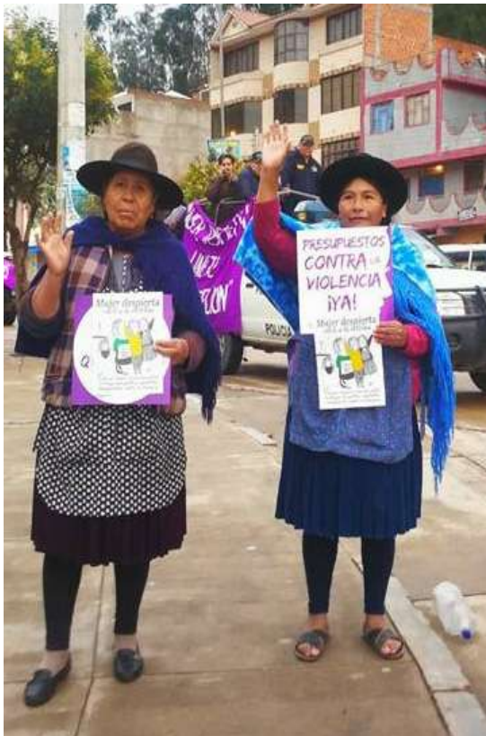
Campaña por presupuestos contra la violencia