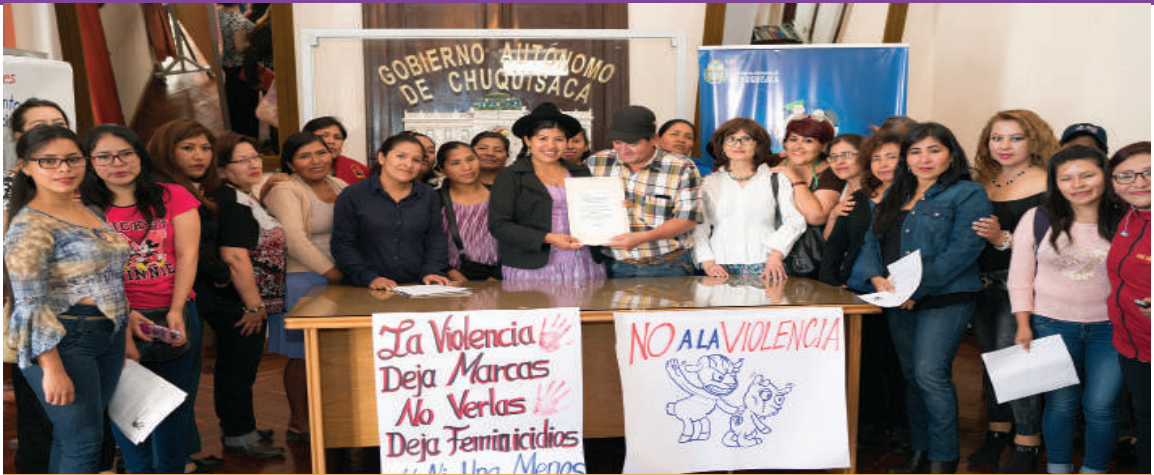
La Directora de la DIO y el Presidente de la Asamblea (centro), junto a lideresas de Chuquisaca, en noviembre 2017

En vísperas del Día Internacional de la Eliminación de la Violencia contra la Mujer, el 24 de noviembre de 2017, la Gobernación de Chuquisaca entregó el proyecto de Ley Departamental de Lucha contra la Violencia hacia la Mujer a la Asamblea Legislativa de este departamento. El acto fue celebrado por las organizaciones de mujeres que, en una construcción colectiva, impulsaron este proyecto junto a instituciones locales y autoridades departamentales.