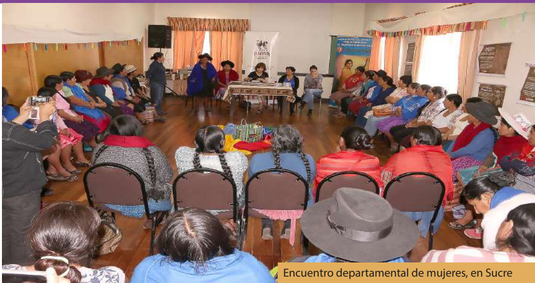
Encuentro departamental de mujeres, en Sucre

La participación plural de las organizaciones de mujeres en la construcción de políticas públicas en materia de género fortalece la democracia en el país. Así coinciden la Coordinadora de la Mujer e IDEA Internacional, dos instituciones que impulsan de manera activa la implementación de normativas favorables a las mujeres en cuatro departamentos del país, entre ellos, Chuquisaca.