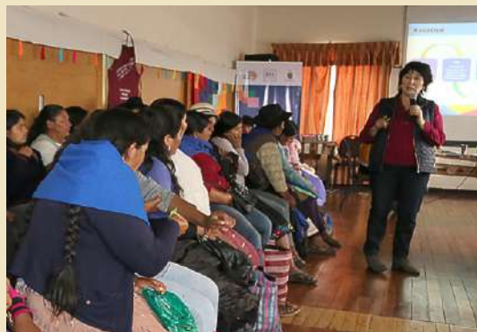
Encuentro realizado por el Centro Juana Azurduy

Sin embargo, a pesar de que este proyecto fue remitido a la Asamblea en noviembre de 2017 y puesto a consideración del pleno, éste no fue aprobado aún hasta julio de 2018.