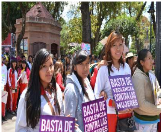
Movilización contra la violencia hacia las mujeres

El 16 de enero de 2013, un escándalo sacudió a la Asamblea Legislativa Departamental de Chuquisaca. Un asambleísta había abusado sexualmente de una funcionaria que se encontraba en total estado de ebriedad, después de un festejo realizado en instalaciones de la institución.