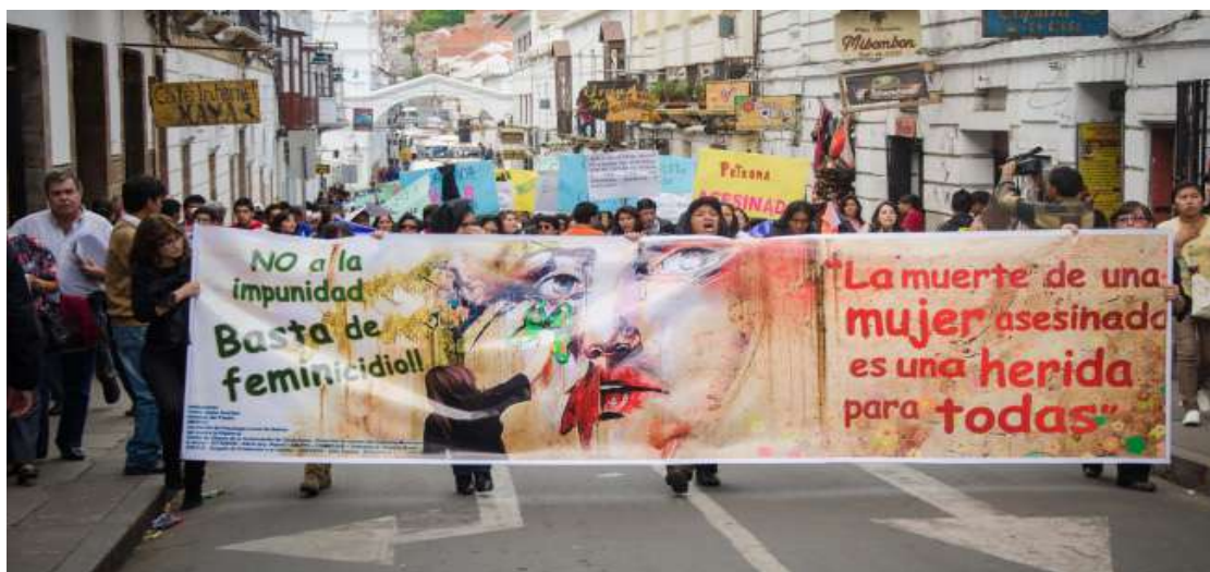
Marcha de protesta contra los feminicidios, con la participación de mujeres de diferentes organizaciones sociales

El Proyecto de Ley pone énfasis en la prevención, atención y protección de las mujeres en situación de violencia. Crea el Consejo Departamental de Lucha contra la Violencia hacia las Mujeres, integrado por instituciones públicas y privadas, ONG, pueblos indígena originario campesinos y sociedad civil.