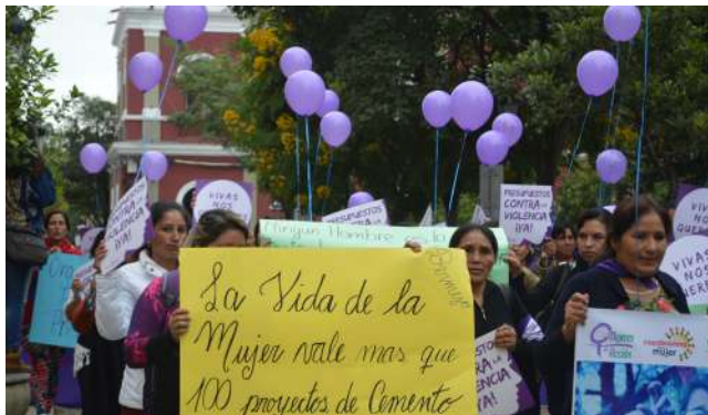
Marcha de organizaciones de mujeres del departamento de Tarija frente a la Gobernación exige presupuesto para luchar contra la violencia de género.

Las autoridades de la Gobernación de Tarija aprobaron un presupuesto de 619.647 bolivianos para apoyar las acciones previstas en el Plan Quinquenal para Reducir y Prevenir la Violencia contra las Mujeres en 2019.