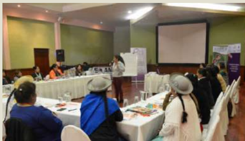
Talleres con mujeres asambleístas departamentales en busca de sororidad.

CCIMCAT y Mujeres en Acción, afiliadas a la Coordinadora de la Mujer en Tarija, desarrollaron diversos talleres y procesos de formación a mujeres representantes de organizaciones de todo el departamento, asambleístas, activistas e independientes en temas relevantes como la Agenda Política del cuidado; poder y liderazgo político de las mujeres; participación y control social con enfoque despatriarcalizador; mecanismos y herramientas para una negociación efectiva; política, planes y presupuestos sensibles a género; alianzas estratégicas en la diversidad: un camino hacia la sororidad.