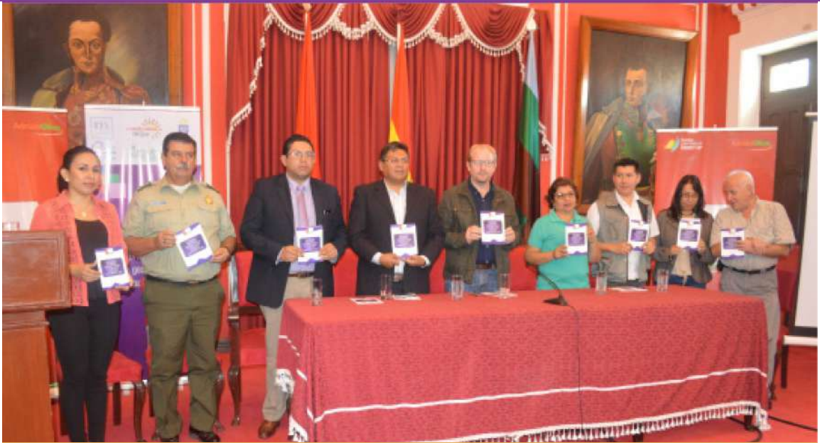
Presentación oficial de la Política Pública de Lucha Contra la Violencia por parte del Gobernador de Tarija a las organizaciones y medios de comunicación.

La violencia hacia las mujeres en Tarija ha obligado a tomar decisiones firmes contra ese problema. Organizaciones femeninas, con apoyo de la Coordinadora de la Mujer, Idea Internacional y la Embajada de Suecia, reunieron a representantes de operadores de justicia, entidades vinculadas con el tema, asambleístas departamentales y servicios legales municipales para analizar la situación y plantear soluciones.