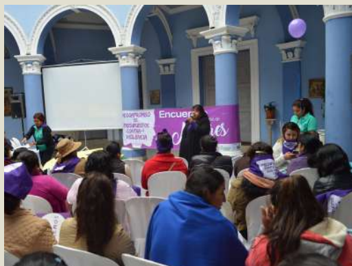
Las mujeres se reunieron con el Gobernador de Tarija para hacerle conocer sus demandas.

Incorporar el enfoque de género en la mirada de las y los tomadores de decisiones y especialmente de quienes planifican en la Gobernación, es un reto para lograr mayores avances en el departamento. En este sentido, Mujeres en Acción, CCIMCAT y la Coordinadora de la Mujer, con el apoyo de IDEA Internacional y la Embajada de Suecia, llevaron adelante en Tarija un proceso de reflexión para el abordaje específico de aspectos vinculados a la igualdad de género desde la gestión y planificación pública.