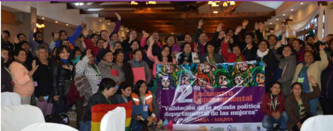
Encuentro departamental de mujeres e instituciones públicas para la socialización y enriquecimiento de la Agenda Política desde las Mujeres del Departamento de Tarija.

Una vez que se han logrado articular esfuerzos institucionales y de organizaciones civiles en torno a la lucha contra la violencia de género en el departamento de Tarija, surgen desafíos para consolidar la unidad y conseguir más conquistas para las mujeres.