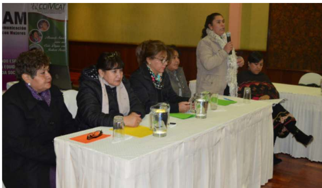
Articulación de mujeres electas de la ALDT en reunión para exigir presupuestos públicos para las mujeres.

Destacó la capacidad de incidencia de las organizaciones de mujeres que lograron sensibilizar y convencer de que la violencia de género es un problema público que merece respuestas reflejadas en políticas públicas. “Tarija –comenta– es un departamento más o menos pequeño, territorial y poblacionalmente. Nos conocemos. Es más fácil poder conversar, ver las cosas”.