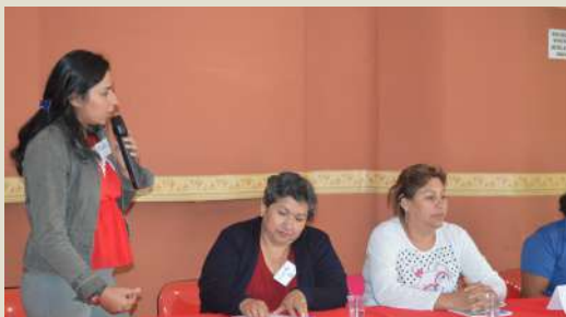
Procesos de formación a mujeres representantes de organizaciones.