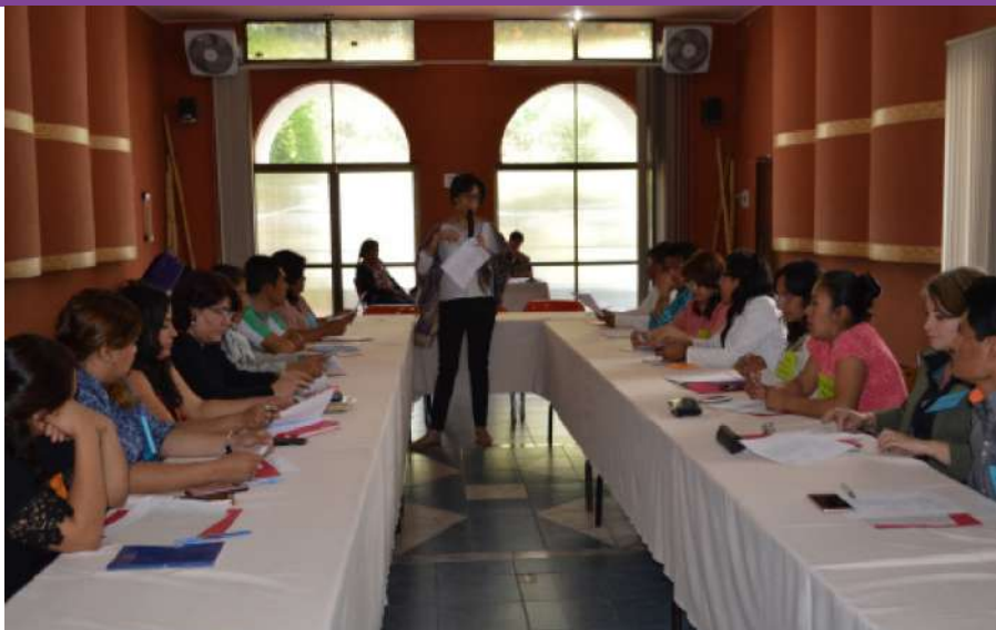
Mesas técnicas con instituciones y organizaciones sociales y de mujeres para elaborar la política pública de lucha contra la violencia.

Vergara, apuesta por una seguridad sostenible sobre la base de la corresponsabilidad