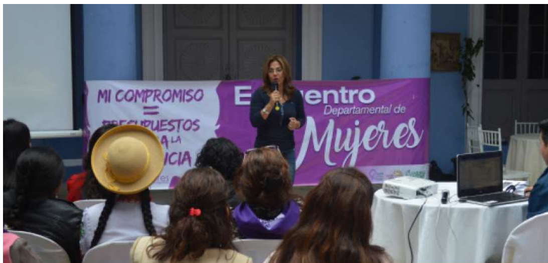
Encuentro departamental de organizaciones de mujeres para validar la Política Pública de Lucha Contra la Violencia, con la participación de mujeres electas de la Asamblea Legislativa Departamental de Tarija.

El artículo 4 ordena crear una instancia dependiente de la Secretaría de Desarrollo Humano de la Gobernación y garantizar la asignación de recursos económicos suficientes para la ejecución de las tareas mencionadas. Finalmente, el artículo 5 refiere que la reglamentación de la ley está a cargo de la Gobernación, en coordinación con las instituciones públicas y privadas que trabajan en la temática de lucha contra la violencia de género.