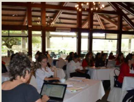
Taller con personal de la Gobernación sobre la incorporación del enfoque de género en la planificación.

CCIMCAT y Mujeres en Acción, afiliadas a la Coordinadora de la Mujer en Tarija, desarrollaron diversos talleres y procesos de formación a mujeres representantes de organizaciones de todo el departamento, asambleístas, activistas e independientes en temas relevantes como la Agenda Política del cuidado; poder y liderazgo político de las mujeres; participación y control social con enfoque despatriarcalizador; mecanismos y herramientas para una negociación efectiva; política, planes y presupuestos sensibles a género; alianzas estratégicas en la diversidad: un camino hacia la sororidad.