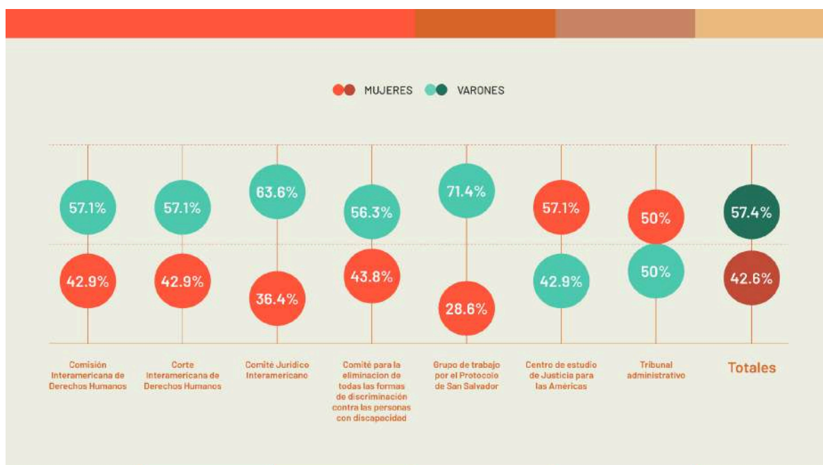
Fig.1. Representación de mujeres y varones en los órganos analizados

21. El Anexo I del presente Informe actualiza los datos recopilados en el Informe de Recomendaciones respecto de 6 órganos con mandatos de protección de derechos humanos e incorpora 2 nuevos, con la intención de observar tendencias respecto de los criterios de integración en otros órganos principales de la OEA donde, al igual que la CIDH y la Corte, los integrantes son elegidos a través de la nominación y votación de Estados Miembros 27 . Los órganos y mecanismos contemplados son: CIDH, Corte IDH, CJI, Tribunal Administrativo, Centro de Estudio de Justicia para las Américas (CEJA), Comité para la Eliminación de todas las formas de discriminación contra las personas con discapacidad (CEDDIS), Grupo de trabajo por el Protocolo de San Salvador, y el Grupo de Trabajo de Seguimiento a la Implementación de la Declaración Americana sobre los Derechos de los Pueblos Indígenas 28 .